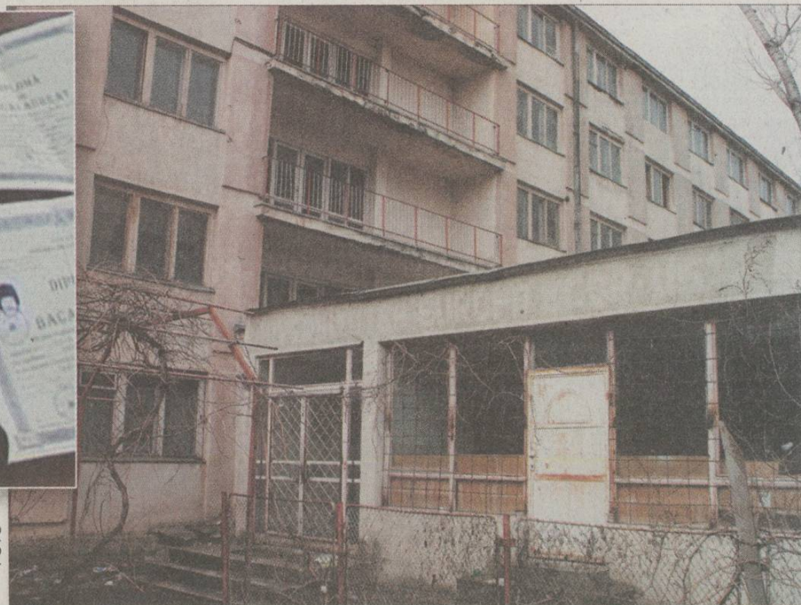
Unul dintre sediile facultății Europa Ecor